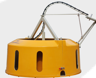
Figarino, zwischenlagerung von Kabeln, ersetzt das 8-er Schlaufenlegen